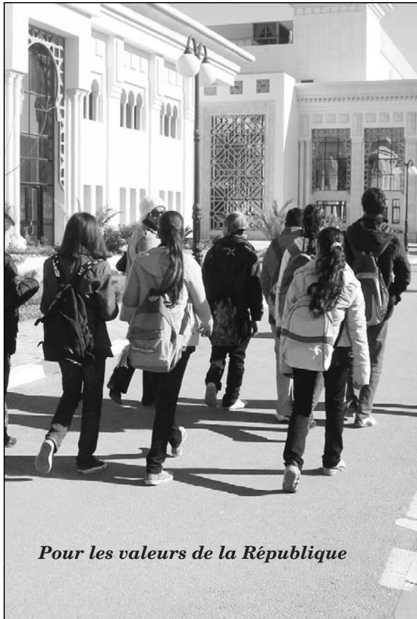
Pour les valeurs de la République

C'est ainsi que les élèves ont pu visiter les musées militaires, le laboratoire de métrologie de l'armée de l'air, les équipements à El Borma, Régim Maâtoug — où ils ont pu apprécier les réalisations grandioses en matière de végétation