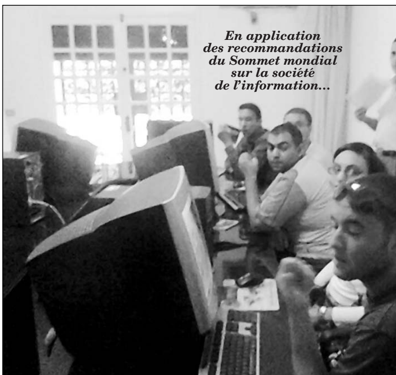
En application des recommandations du Sommet mondial sur la société de l'information...

D'autre part, l'organisation de la Jeunesse scolaire offre l'occasion aux élèves pour visiter les